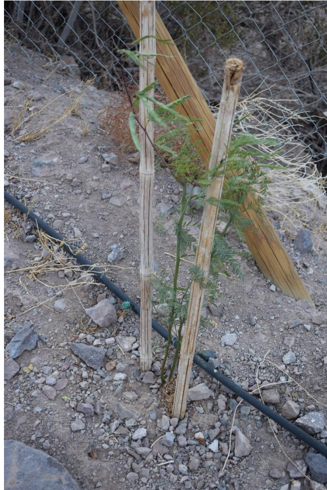
Fotografía 4-3: Detalle del estado de un árbol promedio de la especie Prosopis