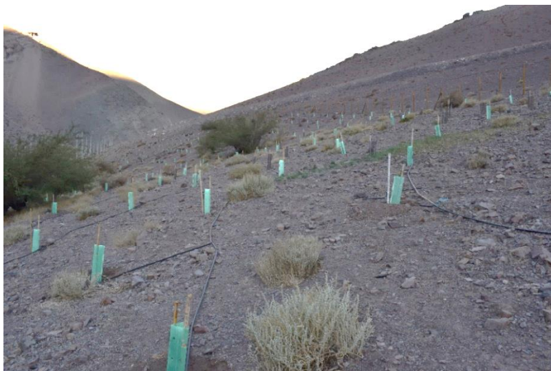
Fotografía 4-2. Vista panorámica del rodal AL 2.