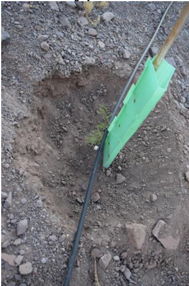
Fotografía 4-4: Detalle de un ejemplar con protección de plástico corrugado y taza para localizar el riego y evitar el escurrimiento del agua