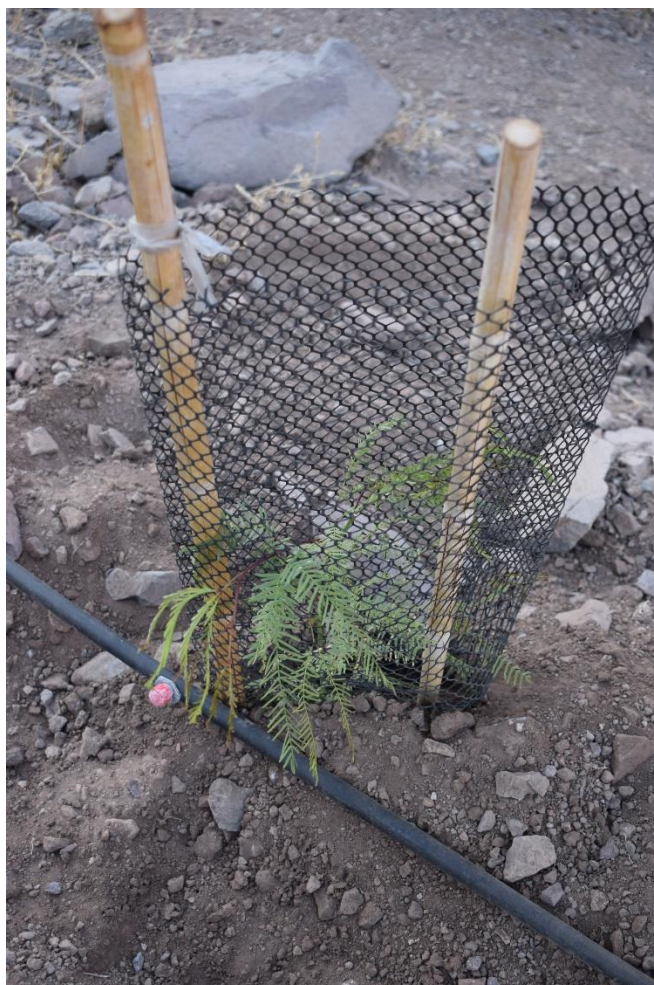
Fotografía 4-5. Detalle de un ejemplar con protección de malla tubo.